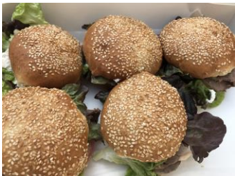
Fællesspisning på HF i anledning af Danmark spiser sammen mod ensomhed.

I uge 17 satte Folkebevægelsen mod Ensomhed fokus på ensomhed under kampagnen #danmarkspisersammen. Denne dag brugte ca. 30 elever fra Campus Bornholm deres frokostpause sammen og fik dermed sagt hej og snakket med en eller flere, som de ikke havde talt med før. Folketingsmedlem fra Bornholm, Lea Wermelin, spiste med og fik en god snak med de unge. Alle de fremmødte kunne nikke genkendende til følelsen af ensomhed. Det kan vi godt blive bedre til at tale om! Tak for dejlig mad til 'Mad med Oplevelser' fra Campus Bornholm. Arrangementet var samtidig en påmindelse for de unge om, at de har nye muligheder for at lave sådanne fælles arrangementer, hvor fokus er på andet end fest og alkohol, når de flytter under samme tag på Campus Bornholm.